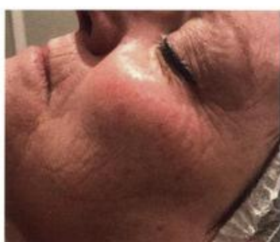
Après 2 traitements