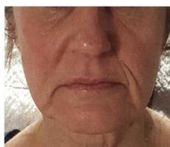
Après 4 traitement