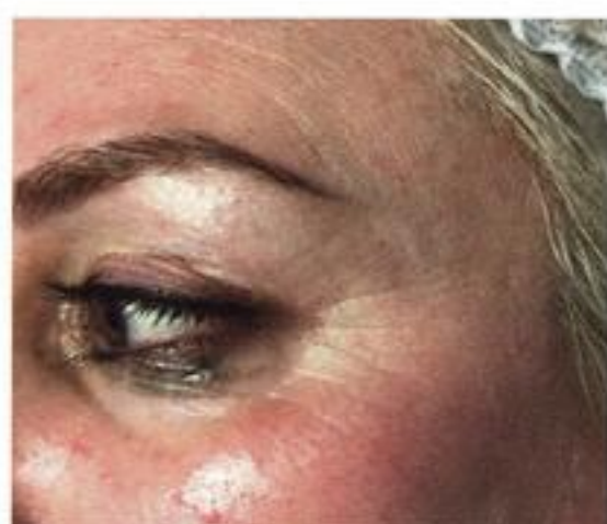
Après 1 traitement