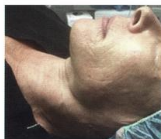
Après 1 traitement